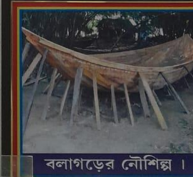
বলাগড়ের নৌশিল্প ।