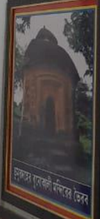
মুসলিম যুগে মন্দির ভৈরব