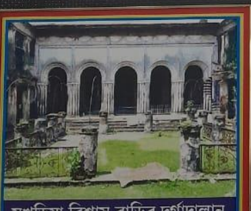
সুখড়িয়া বিশ্বাস বাড়ির দুর্গাদালান