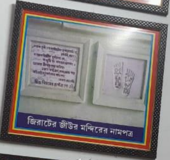
জিলাটির জীউর মন্দিরের নামপত্র