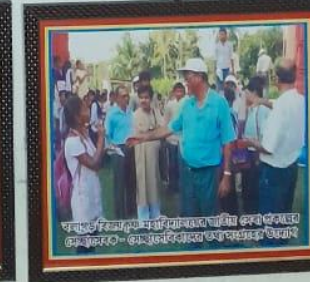
কলকাতা বিশ্ববিদ্যালয়ের মাস্টার্স ডিগ্রির জন্যে এসেছিলেন কলকাতায় - কলকাতা বিশ্ববিদ্যালয়ের অধ্যাপকগণের উদ্দেশ্যে