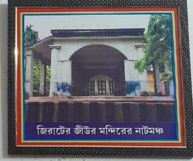
জিরাটের জীউর মন্দিরের নাটমঞ্চ