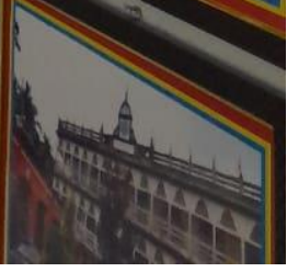
মুসলিম ঐক্যলাভের সাক্ষর