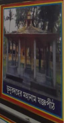
ডুমুরদেহের মহানাম যজ্ঞপীঠ