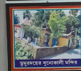
ডুমুরদহের বুনোকালী মন্দির