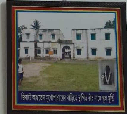
জিরাটে আশুতোষ মুখোপাধ্যায়ের বাঙালি স্থাপিত তাঁর নামে স্থল মূর্তি