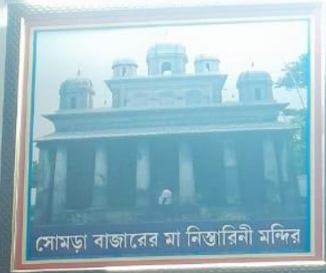
সোমড়া বাজারের মা নিস্তারিনী মন্দির