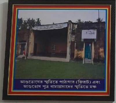
আশুতোষের স্মৃতিতে পাঠাগার (জিরাট) এবং আশুতোষ পুত্র বামাঙ্গসাদের স্মৃতিতে মঞ্চ