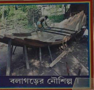
বলাগড়ের নৌশিল্প ।