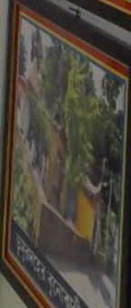
মুসলিম ঐক্যলাভের সাক্ষর