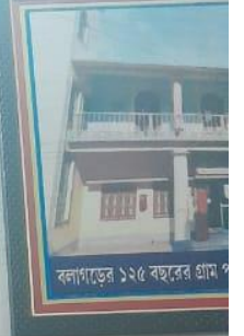
বলাগড়ের ১২৫ বছরের গ্রাম প