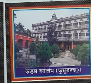
উত্তম আশ্রম (ডুমুরদহ)।