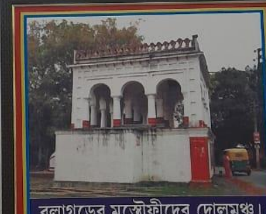
বলাগড়ের মুস্তৌফীদের দোলমখঃ ।