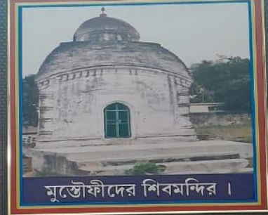
মুস্তৌফীদের শিবমন্দির ।