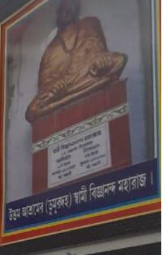
উত্তর ভারতের (মুসলিম) স্বামী বিজ্ঞানক মহারাজ