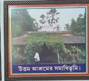
উত্তম আশ্রমের সমাধিভূমি।