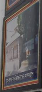
মুসলিম ঐক্যলাভের সাক্ষর