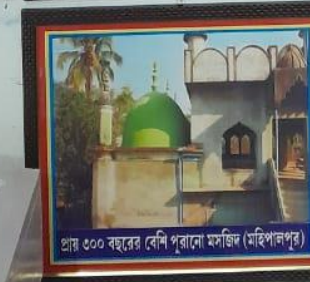
প্রায় ৩০০ বছরের বেশি পুরানো মসজিদ (মহিলালপুর)