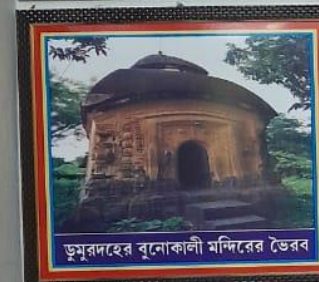
ডুমুরদহের বুনোকালী মন্দিরের ভৈরব