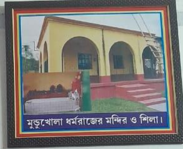
মুন্ডুখোলা ধর্মরাজের মন্দির ও শিলা।