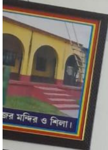
মসজিদ ও শিলা।