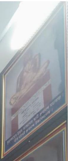
বুদ্ধের উত্তর ভারতের পূর্ব প্রদেশের মসজিদে স্থাপন করা হয়েছে।