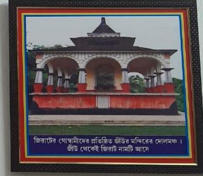
জিরাটের গোস্বামীদের প্রতিষ্ঠিত জীউর মন্দিরের দোলমঞ্চ। জীউ থেকেই জিরাট নামটি আসে