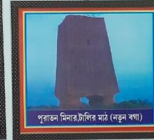
পুরাতন মিনার, টালির মাঠ (নতুন বগা)