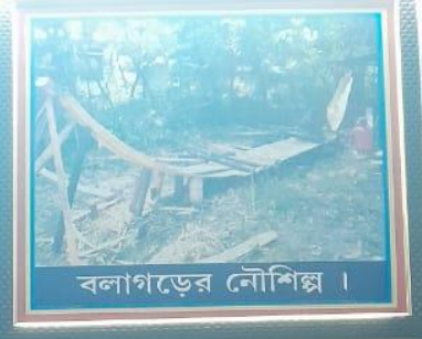
বলাগড়ের নৌশিল্প ।