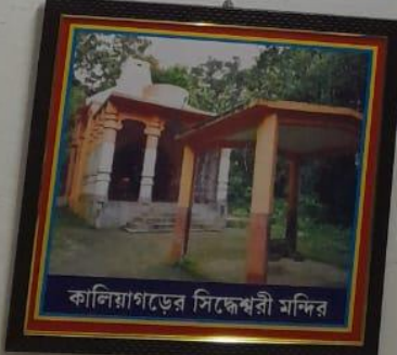
কালিয়াগড়ের সিক্কেশ্বরী মন্দির