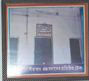
স্বীর সীতারাম ওঙ্কারনাথের প্রতিষ্ঠিত টোল