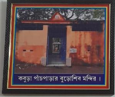
কবুড়া পাঁচপাড়ার বুড়েশিব মন্দির।