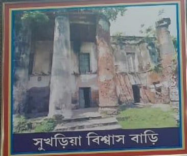
সুখড়িয়া বিশ্বাস বাড়ি