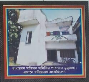
রাধারমন সঙ্গীতম সন্থিতর পাঠাগার ডুমুরদহ। এখানে বরীক্রনাথ এসেছিলেন।