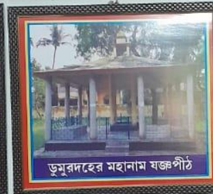
ডুমুরদহের মহানাংম যজ্ঞপীঠ