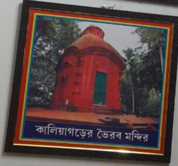
কালিয়াগড়ের ভৈরব মন্দির