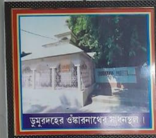
ডুমুরদহের ওঙ্কারনাথের সাধনস্থল।