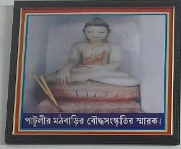
পাটুলীর মঠবাড়ির বৌদ্ধসংস্কৃতির স্মারক।